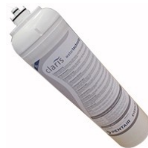
Cartuccia con testata bypass CLARIS XL Cartridge with head bypass CLARIS XL H=471mm