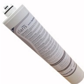
Cartuccia con testata bypass CLARIS M Cartridge with head bypass CLARIS M H=392mm